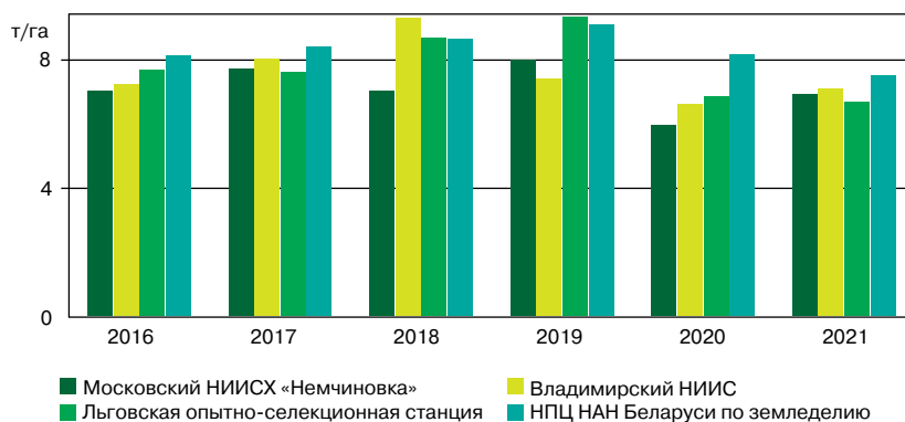
Fig. 1. Crop capacity of winter wheat varieties of different selection centres obtained in the experimental field of the Bryansk State Agricultural University, t/ha

В регионе отмечаются проявления сухой осени. Постоянное снижение гидротермического коэффициента в период сева и осенней вегетации указывает на наличие очень сильных, сильных и средних засух. Для Брянской области риск сильных атмосферных засух составляет в мае 12%, в августе — 20%, в сентябре — 16%. Экстремальные климатических составляющие сказываются на дифференциации урожая и на качестве зерна пшеницы.